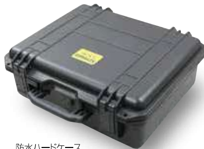
防水ハードケース

AC100VとAC200Vの 同時出力のハイパワー多機能緊急電源装置です。 50/60Hz切替可能で全国どこでも使用可能。 さらに、完全防水仕様のハードケースは悪天候時 にもタフさを発揮。